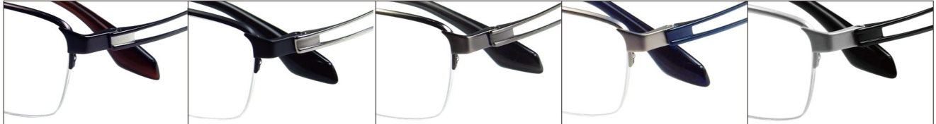
COL.3 Brown COL.4 Black Mat/Silver(Ti 素地) COL.5 Gray COL.7 Silver(Ti 素地)/Blue COL.27 White Pearl/Black Pearl

DUN-2057 ナイロール MEN'S 01260 サイズ: 53□17-145 (¥30.1) / カラー: 5色 / 素材: ゴムメタル、チタニウム / 生産地: 日本・福井県鯖江