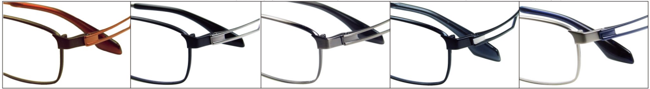
COL.3 Brown/Orange COL.4 Black Mat/Silver(Ti 素地) COL.5 Gray COL.6 Blue COL.7 Silver(Ti 素地)/Blue

DUN-2056 フルリム MEN'S 01260 サイズ: 54□16-145 (¥30.2) / カラー: 5色 / 素材: ゴムメタル、チタニウム / 生産地: 日本・福井県鯖江