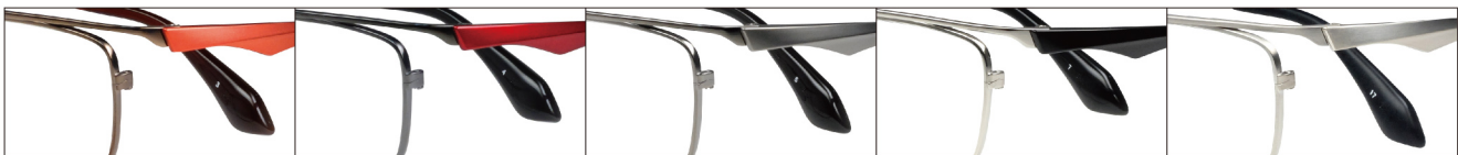
COL.3 IP Brown/Orange Mat COL.4 IP Black/Red COL.5 IP Gray COL.7 Titanium/Black COL.17 Titanium Mat

DUN-2101 フルリム MENS サイズ: 57□14-142 (¥31.0) / カラー: 5色 / 素材: ゴムメタル、チタニウム / 生産地: 日本・福井県鯖江