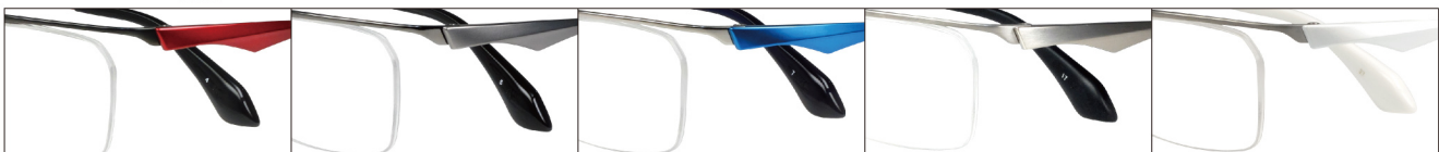
COL.4 IP Black/Red COL.5 IP Gray COL.7 Titanium/Light Blue COL.17 Titanium Mat COL.27 Titanium Mat/Pearl White

DUN-2102 ナイロール MENS サイズ: 56□15-142 (¥31.0) / カラー: 5色 / 素材: ゴムメタル、チタニウム / 生産地: 日本・福井県鯖江