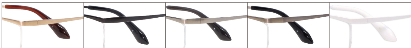
COL.1. Gold Mat

DUN-116 ナイロール MENS サイズ: 54□16-143 (¥31.0) / カラー: 5色 / 素材: ゴムメタル、チタニウム / 生産地: 日本・福井県鯖江