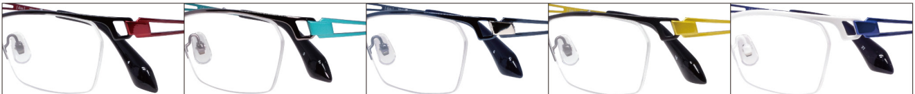
COL.4 Black Mat/Red COL.5 Gray/Peacock Green COL.6 Blue(Silver) COL.15 Gray Mat/Yellow COL.27 Pearl White/Blue

DUN-2124 ナイロール MENS サイズ: 56□15-140 (¥32.0) / カラー: 5色 / 素材: ゴムメタル、チタニウム / 生産地: 日本・福井県鯖江