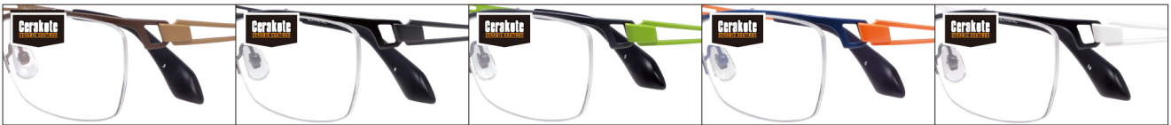
COL.3 Brown Mat/Khaki Mat COL.4 Black Mat/Gray Mat COL.5 Gray Mat/Light Green Mat COL.6 Navy Mat/Flash Orange COL.14 Black Mat/Snow White Mat

DUN-2123 ナイロール MENS サイズ: 55□15-140 (¥33.0) / カラー: 5色 / 素材: ゴムメタル、チタニウム / 生産地: 日本・福井県鯖江