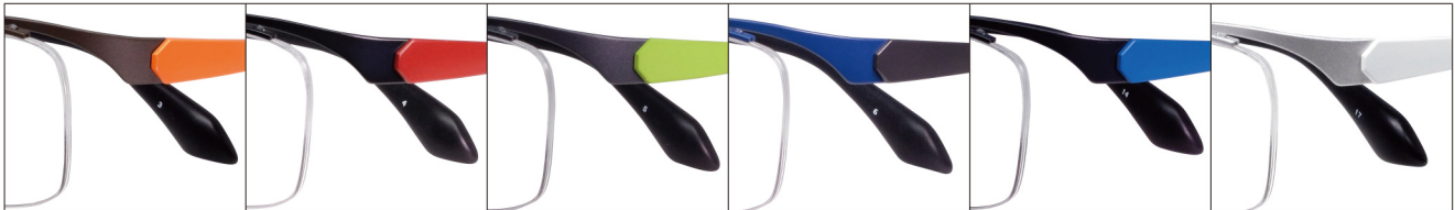
COL.3 Brown Mat/ Flash Orange

DUN-2125 ナイロール MENS サイズ: 54□17-138 (+33.5) / カラー: 6色 / 素材: ゴムメタル、チタニウム / 生産地: 日本・福井県鯖江