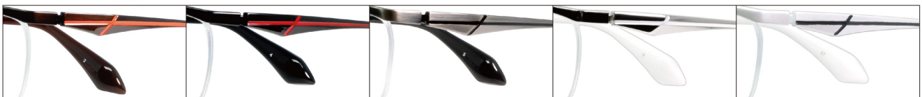
COL.3 Brown (Orange) COL.4 Black (Red) COL.5 Gray (Black) COL.7 Silver (White) COL.27 Pearl White (Dark Gray)

DUN-2130 ナイロール MEN'S サイズ: 57□16-138 (¥33.1) / カラー: 5色 / 素材: ゴムメタル、チタニウム / 生産地: 日本・福井県鯖江