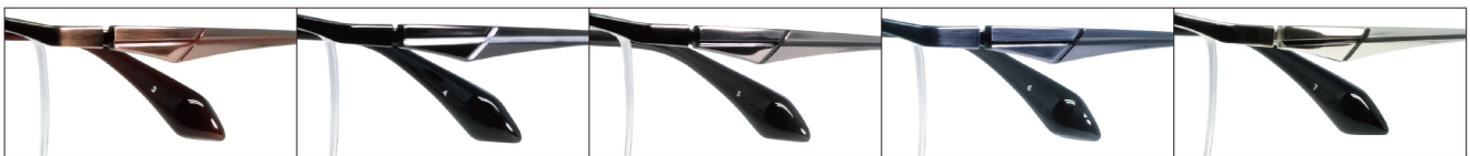
COL.3 Brown (Brown) COL.4 Black (Silver) COL.5 Gray (Black) COL.6 Blue (Black) COL.7 Silver (Black)

DUN-2129 ナイロール MEN'S サイズ: 55□16-138 (¥31.5) / カラー: 5色 / 素材: ゴムメタル、チタニウム / 生産地: 日本・福井県鯖江