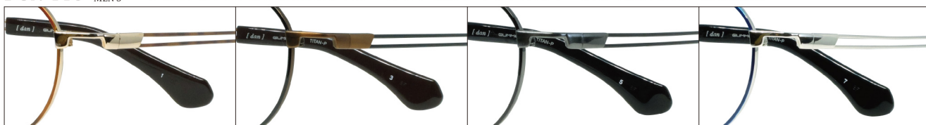
COL.1 Gold(Light Brown Demi)

DUN-118 フルリム MENS サイズ: 47□19-140 (¥40.0) / カラー: 4色 / 素材: ゴムメタル、チタニウム / 生産地: 日本・福井県鯖江