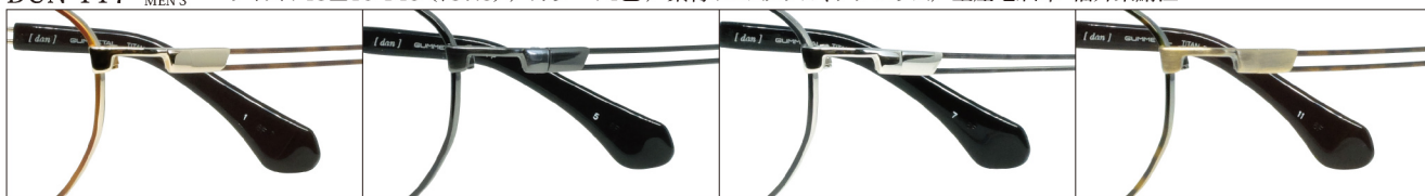
COL.1 Gold(Light Brown Demi)

DUN-117 フルリム MENS サイズ: 48□19-140 (¥37.0) / カラー: 4色 / 素材: ゴムメタル、チタニウム / 生産地: 日本・福井県鯖江