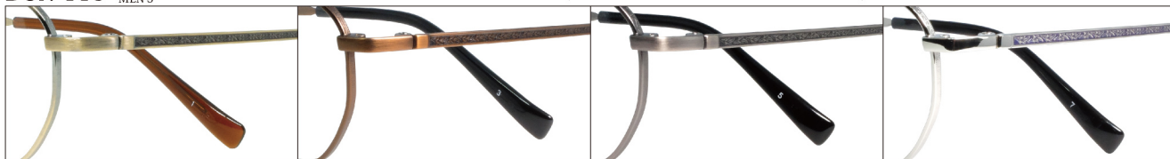
COL.1 Antique Gold(Black)

DUN-119 フルリム MENS サイズ: 48□19-140 (¥37.0) / カラー: 4色 / 素材: ゴムメタル、チタニウム / 生産地: 日本・福井県鯖江