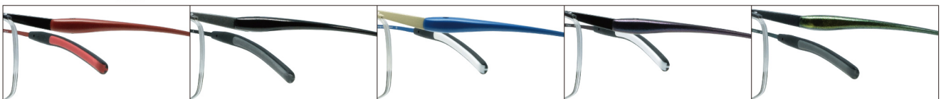
COL.4 Black Mat/Red Mat

サイズ：54□17-133（±31.0）／カラー：5色／素材：ゴムメタル、チタニウム／生産地：日本・福井県鯖江