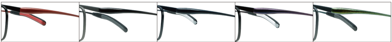
COL.4 Black Mat/Red Mat

サイズ：55□16-133（±30.1）／カラー：5色／素材：ゴムメタル、チタニウム／生産地：日本・福井県鯖江