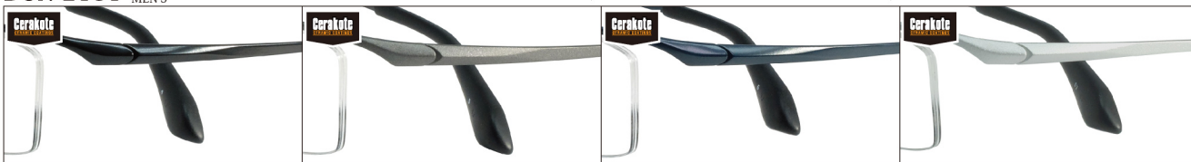
COL.4 Black Mat

DUN-2131 ナイロール MEN'S サイズ：54□15-140 (¥30.0) / カラー：4色 / 素材：ゴムメタル、チタニウム / 生産地：日本・福井県鯖江