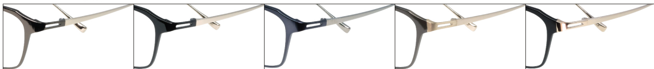
COL.3 Brown/Gold COL.4 Black/Gold COL.6 Blue/Silver Gray COL.13 Brown(Gold Mat)/Gold Mat COL.14 Black(Gold)/Gold

DUN-2143 フルリム MENS サイズ: 53□16-140 (¥34.9) / カラー: 5色 / 素材: ゴムメタル(丁番削り出し一体)、チタニウム / 生産地: 日本・福井県鯖江