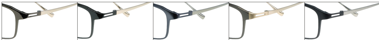
COL.3 Brown/Gold COL.4 Black/Gold COL.6 Blue/Silver Gray COL.13 Brown(Gold Mat)/Gold Mat COL.14 Black Mat/Titanium Mat

DUN-2142 フルリム MENS サイズ: 54□15-140 (¥32.0) / カラー: 5色 / 素材: ゴムメタル(丁番削り出し一体)、チタニウム / 生産地: 日本・福井県鯖江