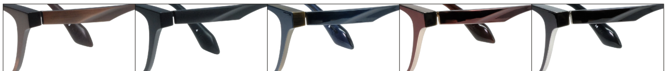
COL.3 Antique Brown Mat

DUN-2145 フルリム MENS サイズ: 54□15-140 (¥35.0) / カラー: 5色 / 素材: ゴムメタル(丁番削り出し一体)、チタニウム / 生産地: 日本・福井県鯖江