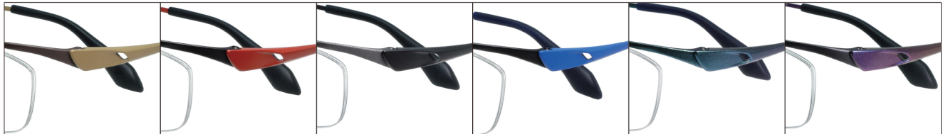
COL.3 Brown Mat/ Khaki Mat

DUN-2146 ナイロール MEN'S サイズ: 56□16-140 (+32.4) / カラー: 6色 / 素材: ゴムメタル(丁番削り出し一体)、チタニウム / 生産地: 日本・福井県鯖江