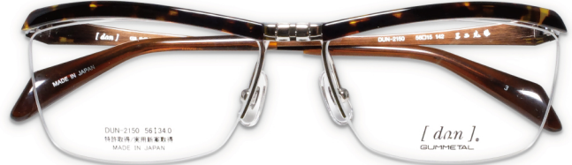
NEW! DUN-2150 COL.3