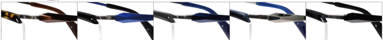
COL.3 Brown Demi(Ti)/Brown COL.4 Black(Ti)/Blue COL.5 Gray Sasa(Ti)/Blue COL.6 Blue Sasa(Ti)/Titanium COL.14 Black Camouflage(Ti)/Black

NEW! DUN-2150 ナイロール MEN'S サイズ：56□15-142（+34.0）／カラー：5色／素材：ゴムメタル、アセテート、チタニウム／生産地：日本・福井県鯖江