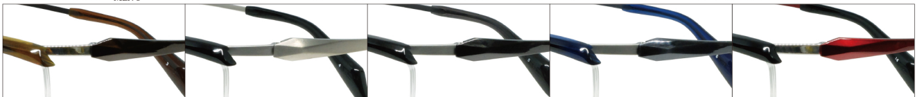
COL.3 Brown(Ti)/Brown COL.4 Black(Ti Mat)/Titanium Mat COL.5 Gray(Ti Mat)/Gray COL.6 Blue(Ti Mat)/Blue COL.14 Black(Ti)/Red

DUN-2149 ナイロール MEN'S サイズ：54□15-142（+31.0）／カラー：5色／素材：ゴムメタル、アセテート、チタニウム／生産地：日本・福井県鯖江