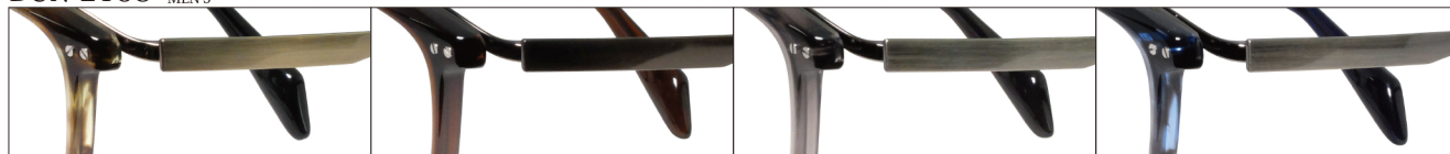
COL.1 Antique Gold/Brown Sasa

DUN-2153 フルリム MEN'S サイズ: 50□21-140 (¥39.0) / カラー: 4色 / 素材、生産地: 上記同様