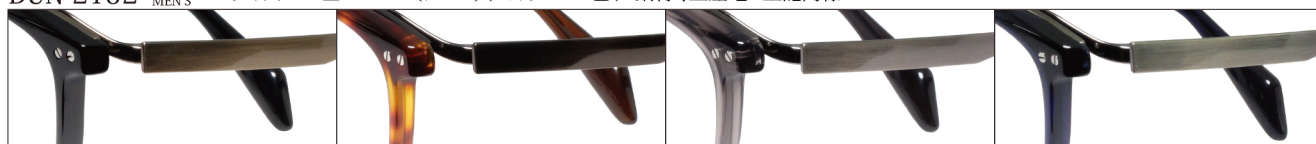
COL.1 Antique Gold/Black

DUN-2152 フルリム MEN'S サイズ: 51□21-140 (¥37.0) / カラー: 4色 / 素材、生産地: 上記同様