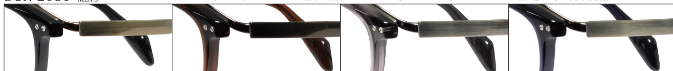
COL.1 Antique Gold/Black

DUN-2151 フルリム MEN'S サイズ: 50□21-140 (¥38.0) / カラー: 4色 / 素材: ゴムメタル、チタニウム、アセテート / 生産地: 日本・福井県鯖江