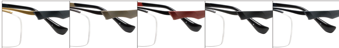
COL.1 Gold Mat/ Dark Navy Mat

DUN-2154 ナイロール MEN'S サイズ：56□16-140（+34.0）／カラー：5色／素材：ゴムメタル（丁番削り出し一体）、チタニウム／生産地：日本・福井県鯖江