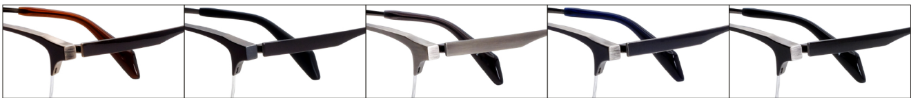
COL.3 Brown/Antique Gold

DUN-2163 ナイロール MEN'S サイズ: 53□16-140 (¥33.0) / カラー: 5色 / 素材: ゴムメタル、チタニウム / 生産地: 日本・福井県鯖江