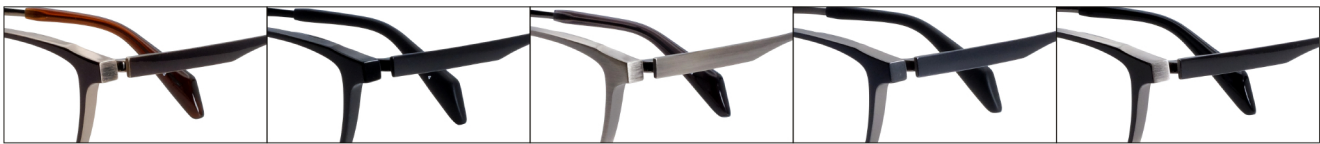
COL.3 Brown/Antique Gold

DUN-2162 フルリム MEN'S サイズ: 54□15-140 (¥33.0) / カラー: 5色 / 素材: ゴムメタル、チタニウム / 生産地: 日本・福井県鯖江