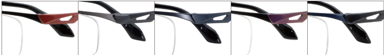
COL.4 Black Mat/ Red Mat

DUN-2167 ナイロール サイズ: 55□16-140 (+33.0) / カラー: 5色 / 素材: ゴムメタル(丁番削り出し一体)、チタンウム / 生産地: 日本・福井県鯖江