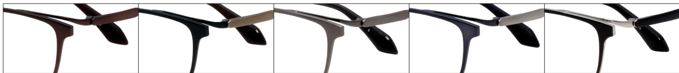
COL.3 Brown Mat COL.4 Black/Antique Gold COL.5 Gray COL.6 Blue/Titanium Mat COL.14 Silver(Black)

DUN-2173 フルリム MEN'S サイズ: 52□16-140 (¥33.8) / カラー: 5色 / 素材: ゴムメタル、チタニウム / 生産地: 日本・福井県鯖江