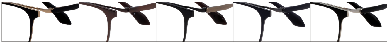
COL.1 Gold Mat(Black Mat) COL.3 Brown Mat COL.4 Black/Antique Gold COL.6 Gray Mat(Blue Mat) COL.14 Silver Mat(Black Mat)

DUN-2172 フルリム MEN'S サイズ: 50□18-140 (¥38.0) / カラー: 5色 / 素材: ゴムメタル、チタニウム / 生産地: 日本・福井県鯖江