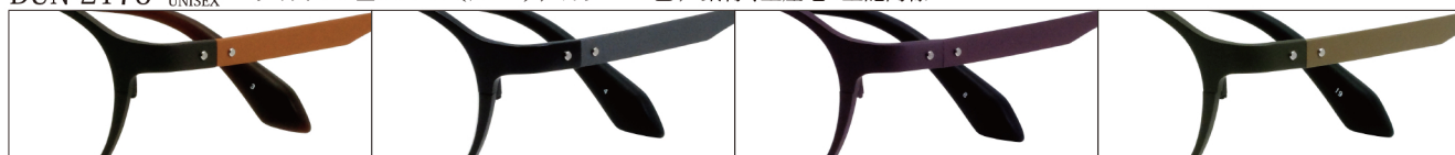
COL.3 Brown Mat/Orange Mat

DUN-2175 フルリム UNISEX サイズ: 47□20-143 (¥39.0) / カラー: 4色 / 素材、生産地: 上記同様