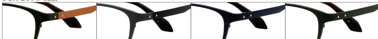
COL.3 Brown Mat/Orange Mat

DUN-2174 フルリム UNISEX サイズ: 52□17-143 (¥32.4) / カラー: 4色 / 素材: ゴムメタル、チタニウム / 生産地: 日本・福井県鯖江