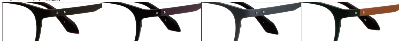
COL.3 Brown Mat

DUN-2176 フルリム UNISEX サイズ: 52□19-143 (¥36.6) / カラー: 4色 / 素材、生産地: 上記同様