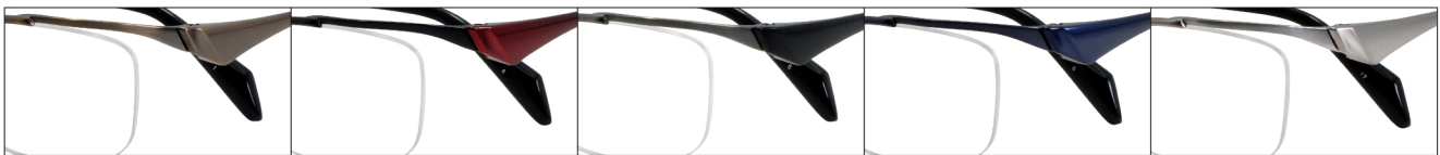
COL.1 Antique Gold COL.4 Black/Red COL.5 Gray/Black Mat COL.6 Blue/Blue COL.17 Titanium Mat

DUN-2178 ナイロール MEN'S サイズ：52□16-140 (¥34.0) / カラー：5色 / 素材：ゴムメタル、チタニウム / 生産地：日本・福井県鯖江