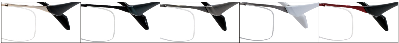
COL.1 Gold/Black Mat COL.4 Black/Green COL.5 Gray COL.17 Titanium Mat/Pearl White COL.28 Red/Black Mat

DUN-2177 ナイロール MEN'S サイズ：52□16-140 (¥32.0) / カラー：5色 / 素材：ゴムメタル、チタニウム / 生産地：日本・福井県鯖江