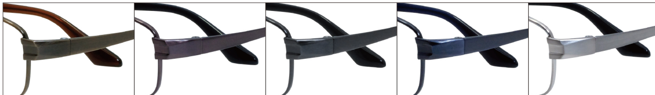
COL.1 Antique Gold

DUN-2180 フルリム MEN'S サイズ: 55□16-143 (+34.0) / カラー: 5色 / 素材: ゴムメタル、チタニウム / 生産地: 日本・福井県鯖江