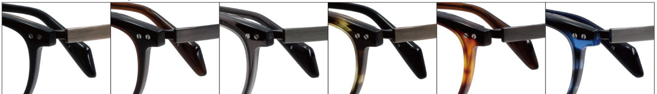
COL.1 Antique Gold/Black

カラー: 3型共通6色 / 素材: βチタン、チタニウム / 生産地: 日本・福井県鯖江