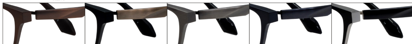
COL.3 Antique Brown Mat COL.4 Black Mat/Antique Gold COL.5 Gray COL.6 Blue COL.14 Black(Silver)

DUN-6002 フルリム MEN'S サイズ: 54□15-140 (¥35.0) / カラー: 5色 / 素材: βチタン(丁番削り出し一体)、チタニウム / 生産地: 日本・福井県鯖江