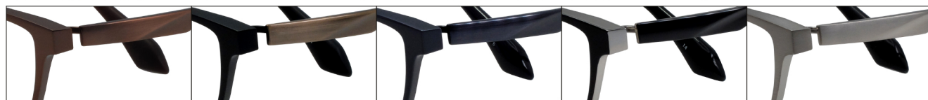
COL.3 Antique Brown Mat COL.4 Black Mat/Antique Gold COL.6 Blue COL.14 Black(Silver) COL.17 Titanium Mat

DUN-6001 フルリム MEN'S サイズ: 54□15-140 (¥31.5) / カラー: 5色 / 素材: βチタン(丁番削り出し一体)、チタニウム / 生産地: 日本・福井県鯖江