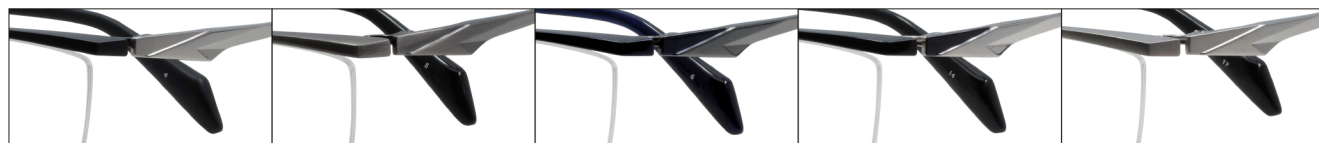
COL.4 Black Mat/Titanium Mat COL.5 Gray COL.6 Blue/Gray COL.14 Black/Silver COL.17 Titanium Mat

DUN-6003 ナイロール MEN'S サイズ: 54□16-140 (¥33.0) / カラー: 5色 / 素材: βチタン、チタニウム / 生産地: 日本・福井県鯖江