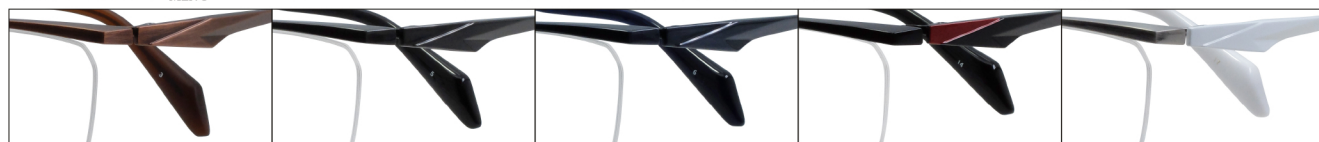
COL.3 Antique Brown Mat COL.5 Gray COL.6 Blue COL.14 Black (Red) COL.17 Titanium Mat/Pearl White

DUN-6004 ナイロール MEN'S サイズ: 54□16-140 (¥36.0) / カラー: 5色 / 素材: βチタン、チタニウム / 生産地: 日本・福井県鯖江