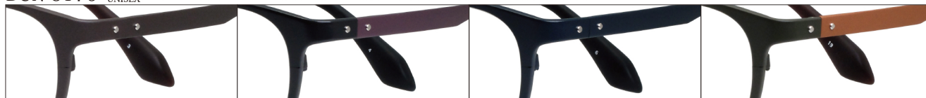
COL.3 Brown Mat

DUN-5176 フルリム UNISEX サイズ: 52□19-143 (¥36.6) / カラー: 4色 / 素材、生産地: 上記同様