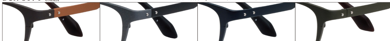
COL.3 Brown Mat/Orange Mat

DUN-5174 フルリム UNISEX サイズ: 52□17-143 (¥32.4) / カラー: 4色 / 素材: βチタン、チタニウム / 生産地: 日本・福井県鯖江