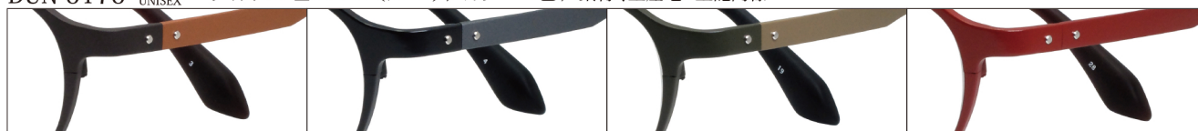
COL.3 Brown Mat/Orange Mat

DUN-5175 フルリム UNISEX サイズ: 47□20-143 (¥39.0) / カラー: 4色 / 素材、生産地: 上記同様